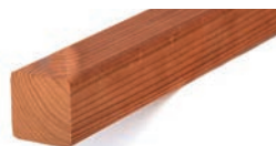
Luna SHP 42x42 ympärihöylätty