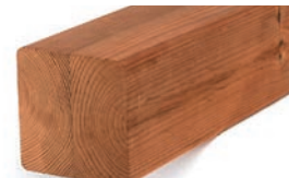
Luna SHP liimapuutolppa 88x88 ympärihöylätty