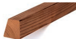
Luna VINORIMA HSS 28/42x42