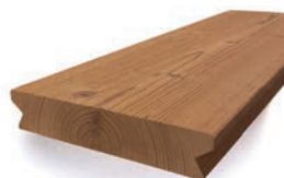
Luna SHP Profix 3 terassilauta 32x166 harjattu